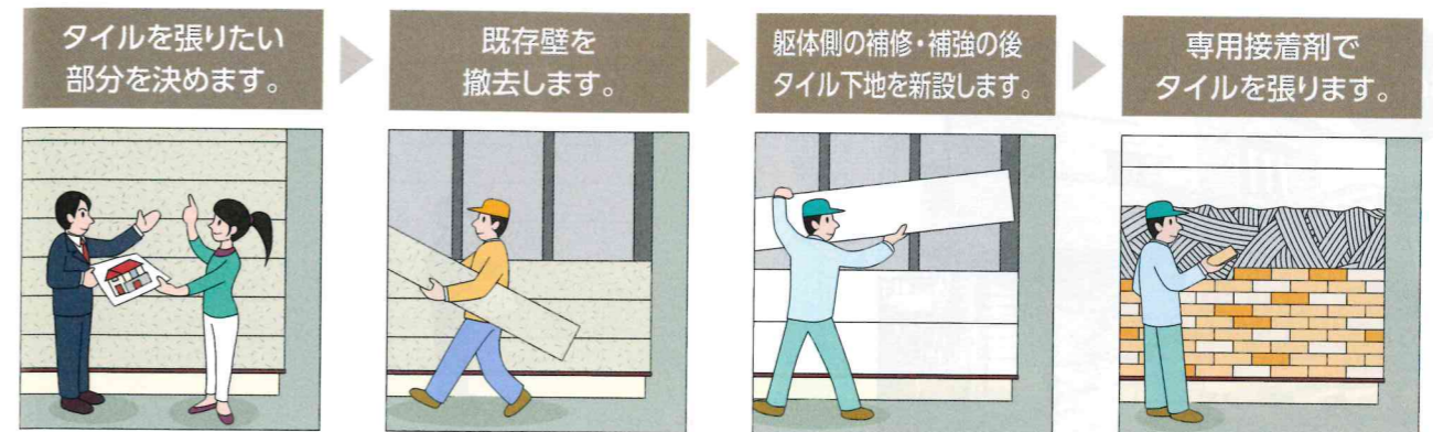
※イメージは、はるかべ工法の場合